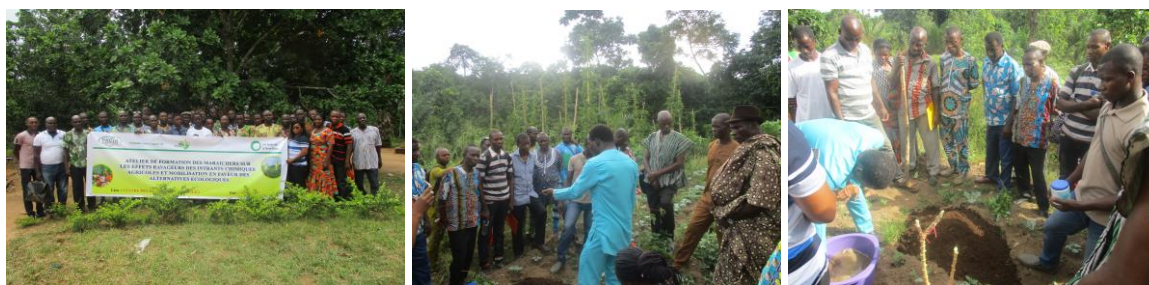
Photo de famille des participants ; les participants attentifs à la démonstration pratique de terrain

Initié par l'Alliance Panafricaine pour la Justice Climatique, branche togolaise, (PACJA-Togo) et l'ONG Les Amis de la Terre-Togo (ADT-Togo), il a été organisé à Danyi-Atigba, le 24 avril 2019, un atelier de formation des maraichers sur les effets ravageurs des intrants chimiques agricoles et mobilisation en faveur des alternatives écologiques.