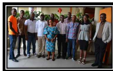
Atelier de validation de l'étude à Lomé

Financé par Milieudefensie, Les Amis de la Terre-Togo a coordonné une étude sur l'exploitation du pétrole en Afrique de l'ouest. En effet, ce projet a été initié au regard des énormes défis environnementaux, socio-économiques et de durabilité des systèmes économiques actuelles que pose l'exploitation de pétrole dans le monde. Il prend en compte les besoins sans cesse grandissants des populations qui croissent avec les efforts mondiaux de réduction des émissions de CO 2 pour limiter le réchauffement de la planète en dessous de 1.5°C (conformément à l'Accord de Paris sur les changements climatiques en 2015) et en considération de la grande réputation du secteur de la pêche pour la subsistance de millions de personnes en Afrique de l'Ouest. Pour Les Amis de la Terre-Togo, il est nécessaire de comprendre l'interaction pétrole/gaz-pêcheurs et de mettre en exergue les risques d'une économie de carbone pour les économies en voie de développement comme l'Afrique de l'Ouest. Il est donc indispensable d'identifier les impacts ou les impacts potentiels de l'exploitation du pétrole et du gaz le long du littoral et autres plans d'eau sur le monde de la pêche (pêcheurs, femmes travaillant dans la transformation de poissons et les membres de l'alliance des réseaux de pêcheurs) et les consommateurs en Afrique de l'Ouest.