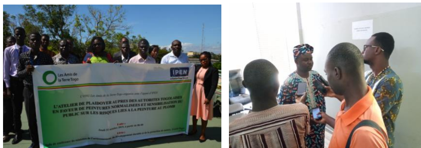
Photo de famille des participants ; interview du Directeur Exécutif a.i

Les Amis de la Terre Togo travaille pour l'adoption d'une réglementation sur le plomb dans la peinture au Togo par le Gouvernement.