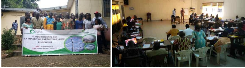
Fora d'Atakpamé et de Dapaong

La transition énergétique est un objectif écologique qui consiste en un changement du système énergétique actuel vers un nouveau système énergétique basé sur des ressources renouvelables. Cela consiste principalement à réduire la consommation d'énergies fossiles dans une grande part des activités de l'homme comme l'industrie, les transports, l'éclairage, le bâtiment, l'utilisation et affectation des terres, etc. Elle implique également un changement de politique énergétique tout en contribuant à une meilleure efficacité énergétique dont les principaux enjeux sont :