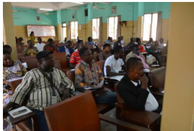
les participants en salle